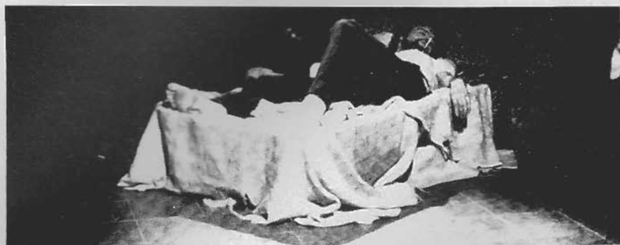
Després dels assajos, aquesta és la situació en què es troben els membres del Talleret. Abaltats, tanquen i esperen unes solvents cançons que no arriben. «Què ajuda al teatre? Qui els treu aquesta nyonya?»

Finalment, i atenent a la importància que en algunes zones de Catalunya té el teatre d'aficionats, el Servei de Teatre ha posat a disposició de tots els grups, en la seu dels seus respectius Serveis Territorials, gairebé la totalitat de textos teatrals en català existents (tant d'autors catalans com traduccions) perquè aquests grups tinguin a l'abast un catàleg prou extens de possibilitats de muntatges.